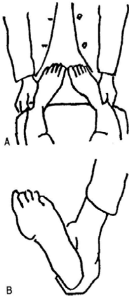
Fig. 1 Position des mains du praticien qui empaument le pied du patient pour le test des rotateurs externes de hanche (d'après Gagey et Gentaz, 1996). En A, vue de la position du praticien depuis celle du sujet allongé sur la table d'examen ; en B : vue de la plante du pied du sujet : les doigts du praticien n'empiètent pas sur la sole plantaire.

Le patient est en décubitus dorsal, sur la table d'examen. Les bras sont relâchés le long du corps, la tête en position neutre, le regard au plafond, la bouche fermée, les lèvres en position de repos (Gagey & Weber, 2000, 2001). L'examineur se place en bout de table, empaument les talons du patient sans toucher la sole plantaire, les pieds étant décollés de 1 à 2 cm, suffisamment écartés pour permettre le mouvement (fig 1). L'opérateur doit avoir les coudes tendus, le corps dans l'axe du sujet, la tête et les yeux droits devant, toujours dans la même position. Il imprime avec ses poignets 5 à 6 mouvements rapides (de l'ordre de 2 Hz), symétriques et simultanés de rotation interne des deux pieds du sujet. Afin d'interférer le moins possible avec sa réponse, il concentre son attention sur le mouvement qu'il ressent, la résistance opposée à ce mouvement passif par le tonus des muscles rotateurs externes de chaque cuisse. Les premiers mouvements servent à obtenir la détente du sujet, à vérifier qu'ils n'entraînent pas de contraction parasite ni de douleur. En cas d'échec, le test est recommencé immédiatement, à moins que les douleurs qu'il provoque n'excluent le sujet du protocole.